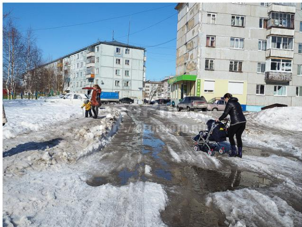
© Сергей Сергеевич Устинов, Коми Республика, spring Евгений Сергей (С) GeoPhoto.Ru

Для нас северян погода очень важна и неожиданности в климате не самая радостная новость... Кому понравится разрушать свои планы, которые